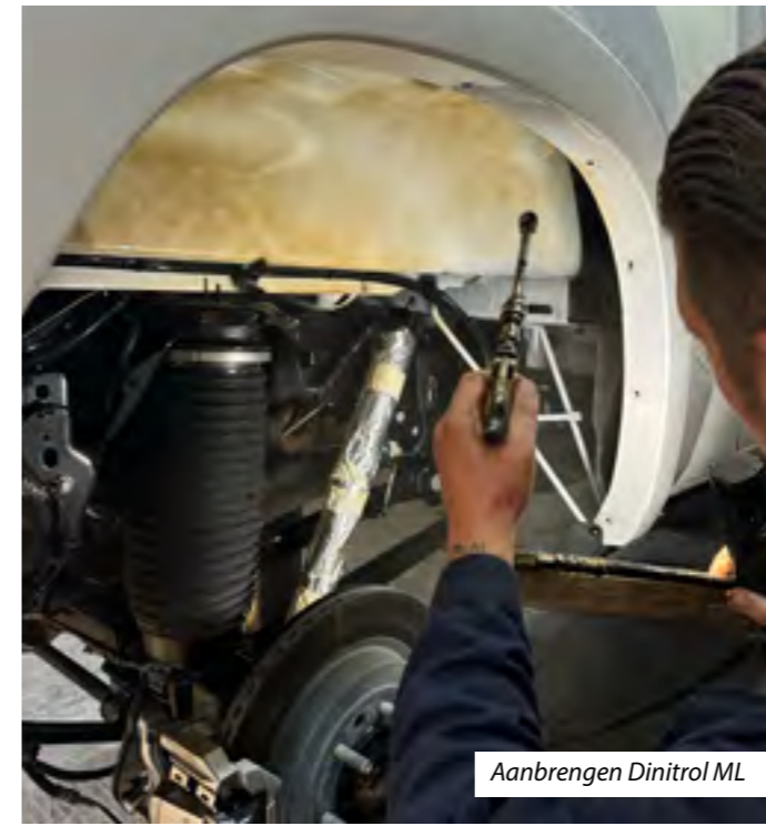
Aanbrengen Dinitrol ML

Van alle merken en types kent men de bijzonderheden en aandachtspunten, zodat er geen plekje onbehandeld blijft. Gosliga raadt aan om, afhankelijk van de gebruiks- en stallingscondities, na 5 à 6 jaar een afspraak te maken voor een herhalingsbeurt. Na 2 à 3 jaar kunt u de auto gratis even laten checken waarbij er, behalve voor het eventueel reinigen, geen spuitkosten verschuldigd zijn. Voor nieuwe auto's, maar zeker ook voor klassiekers, is het geïnvesteerde bedrag