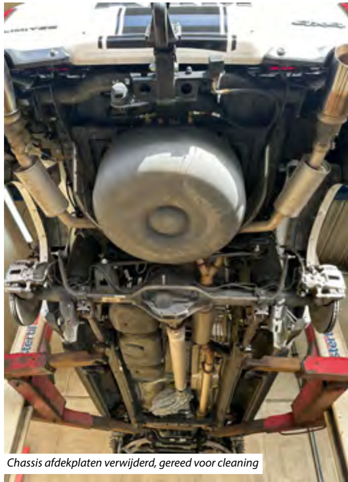
Chassis afdekplaten verwijderd, gereed voor cleaning