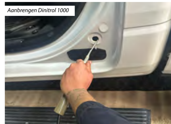
Aanbrengen Dinitrol 1000

voor de conservering van jouw kostbare bezit maar een fractie van de aanschaffingsprijs.